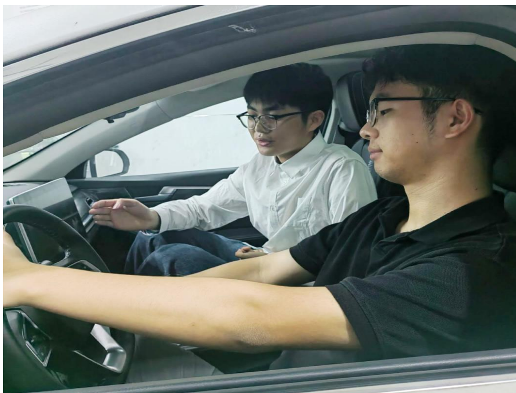
图 2-3-1 我校第二十一届技能运动会活动现场

案例 2-3-1【我校第二十一届技能运动会圆满落幕】 2024年9月21日，我校举办了第二十一届技能运动会，240多名师生参加了通用机电设备装调、新能源汽车维修、移动应用开发、会计技能、声乐表演等17个项目竞赛。