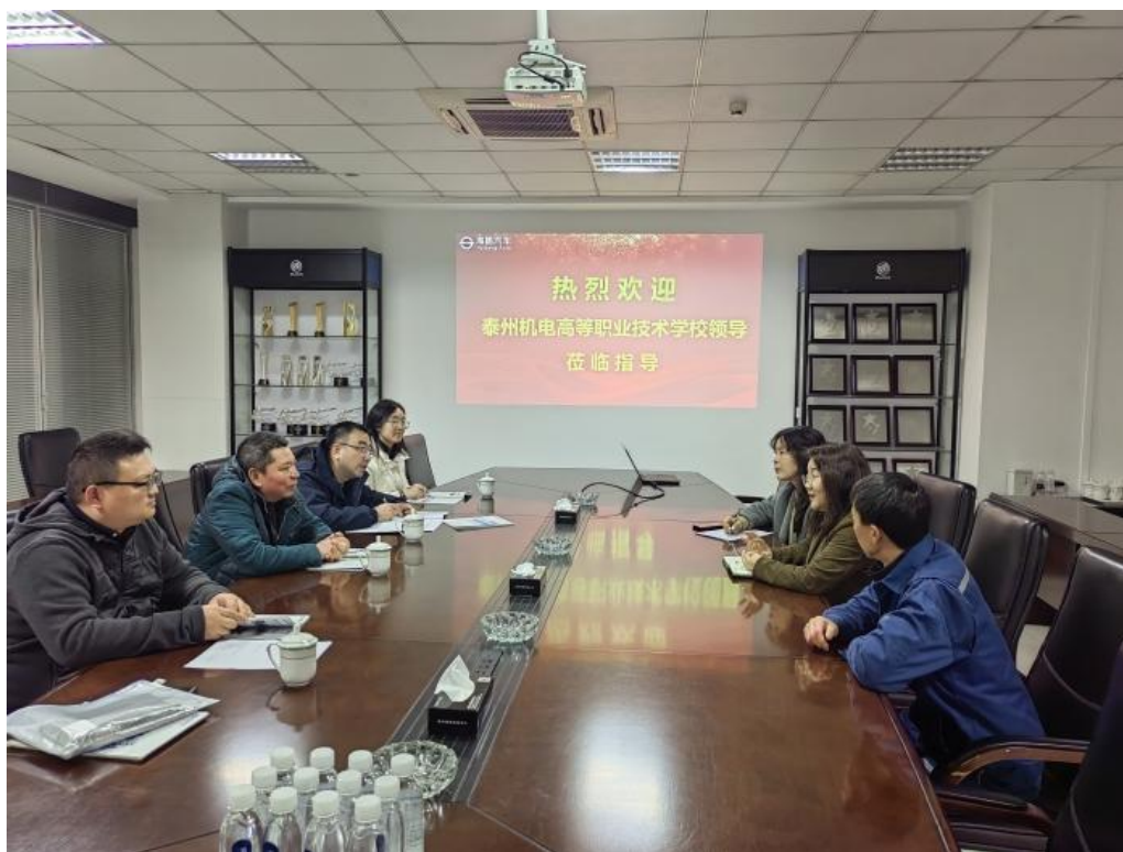
图 3-1-1 汽车系深入实习单位开展巡查现场