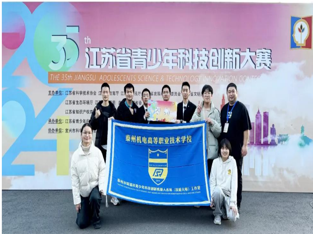
图 2-3-2 第三十五届江苏省青少年科技创新大赛中活动现场

近年来我校高度重视学生创新意识和实践动手能力的培养,鼓励学生组建创新团队。我校学生科技创新和学科竞赛得到了广泛、深入、持久、有效的发展,激励了学生创新能力地提高,营造了浓厚的校园科技创新氛围。学校将以此获奖为契机,在广大师生中继续大力弘扬科学精神、激发创新意识,让更多的青少年乘着时代春风,放飞创新梦想!