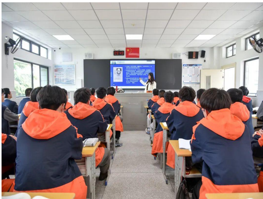
图 7-5-1 我校西教学楼加固改造后重新启用教室现场