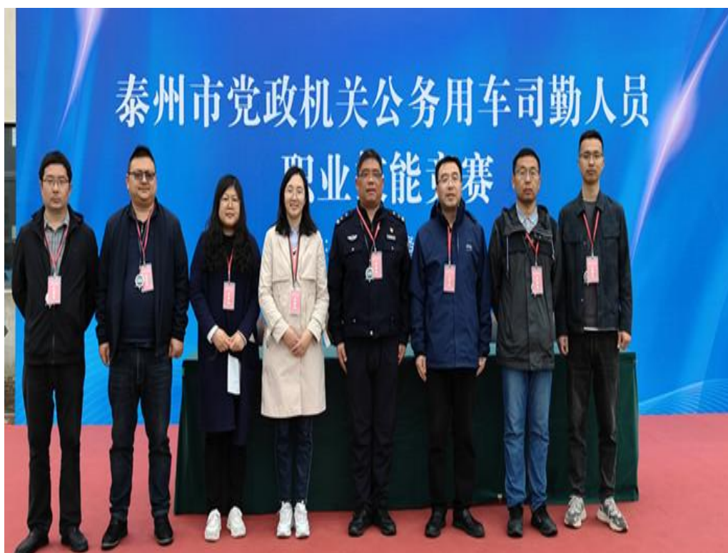
图 3-1-2 汽车技术团队指导泰州市党政机关司勤人员在省赛夺冠现场