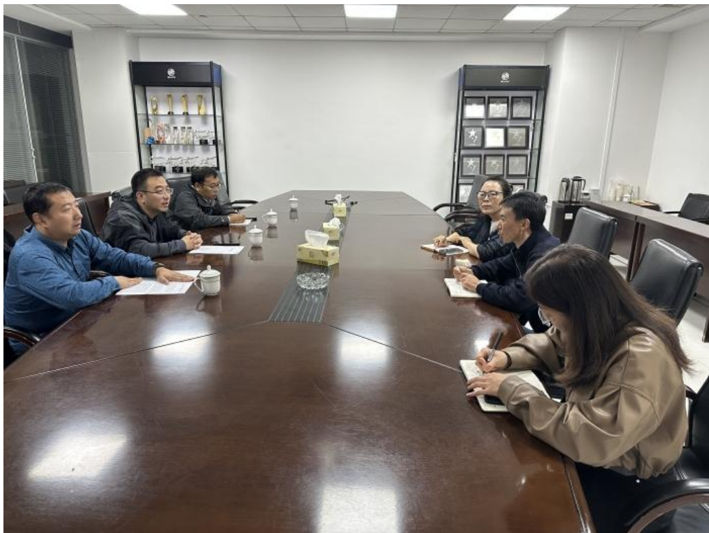
图 6-2-1 汽车工程系赴汽车城与企业洽谈现场

校企双方围绕现代学徒制培养、产教融合共同体建设，探讨了在课程共建、资源共享、企业导师进校授课等方面的合作，并对后期的合作方向进行了规划。此次洽谈为汽车工程系与江苏和源车业、泰州海鹏汽车的合作奠定了坚实基础，标志着校企合作迈上了新台阶。未来，汽车工程系将继续深化产教融合，携手企业，共同推动汽车专业的高质量发展。