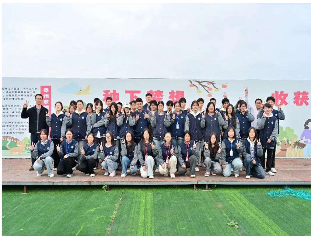
图 2-4-2 男生女生农业基地赛“手艺”现场

近年来，学校以建立校外农业类劳动基地为切入点，逐步构建劳动教育体系，设立劳动教育必修选修课程，通过强化劳动教育，落实劳动精神、劳模精神、工匠精神等专题教育和活动，将劳动素养纳入学生综合素质教育评价体系，不断提升学生综合素养。