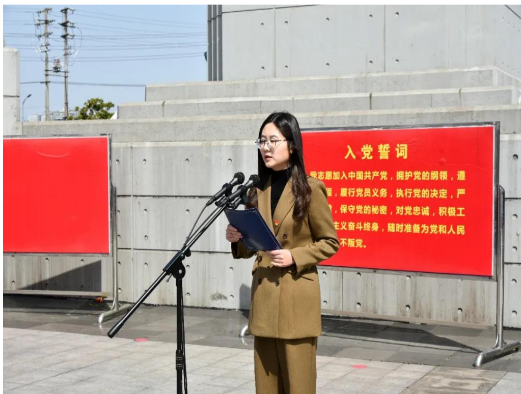
图 5-2-2 2024 年清明祭英烈主题教育现场

开展“弘扬先烈精神 传承红色基因”系列活动——军训拉练。通过严格的军事训练提高学生的政治觉悟，激发爱国热情，发扬革命英雄主义精神，培养艰苦奋斗，刻苦耐劳的坚强毅力和集体主义精神，增强国防观念和组织纪律性，养成良好的学风和生活作风，掌握基本军事知识和技能。