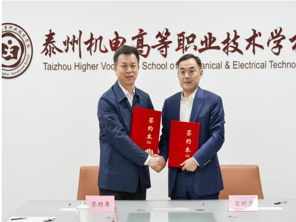
图 6-1-1 江苏理工学院实习基地在我校挂牌成立现场

此次实习基地的挂牌成立，不仅是两校合作的一次生动实践，更是双方共同提升人才培养质量、打造更广阔实践育人平台的有力探索。未来，两校将继续深化合作，共同为培养更多优秀职业教育人才贡献力量。