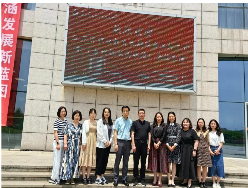
图 6-4-2 省仇娴财会名师工作室举办省级职业教育会计名师工作室交流活动现场