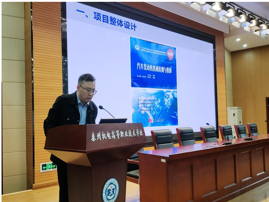
图 7-2-12024 年“新锐营”青年教师教学设计与展示交流活动现场

此次教学设计与展示交流活动着眼提升青年教师教学能力，为青年教师搭建了一个学习、分享和展示的平台。该活动使“新锐营”教师们开阔了教学视野，增强了专业能力，更新了教学竞赛理念。教师们纷纷表示定会以此为契机，充分学习吸收好的教学经验和教学方法，进一步优化教学设计和课堂教学，稳步提升教学和育人质量。