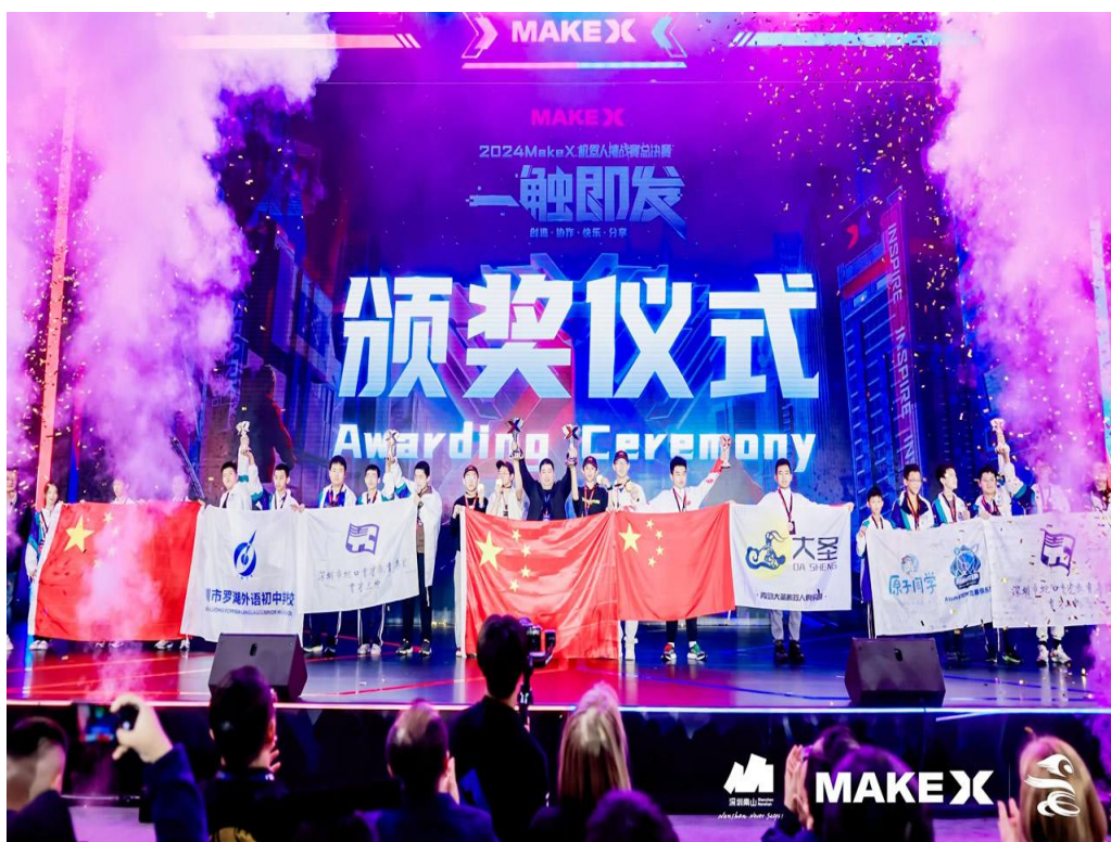
图 4-4-1 我校师生在 2024 Makex 机器人挑战赛总决赛中勇夺全球总冠军现场