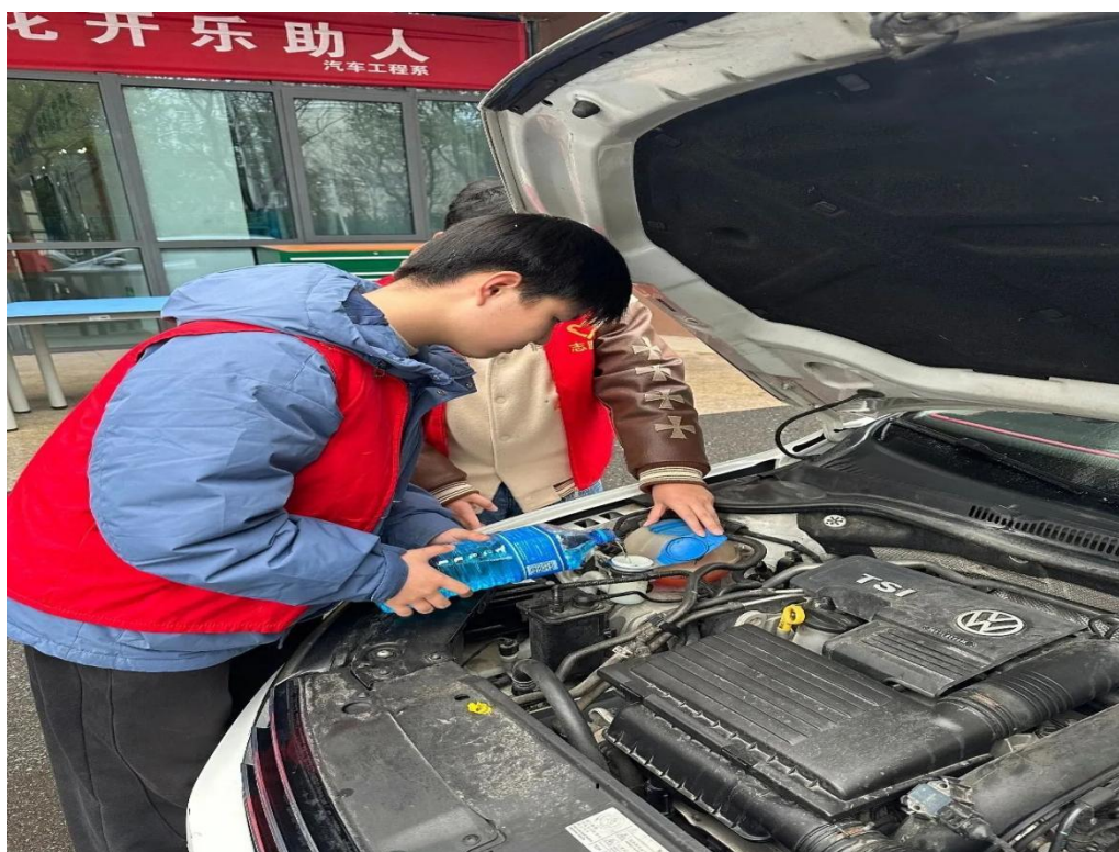
图 5-3-2 学雷锋主题教育实践活动现场

四是扎实展开“中华经典诵读”活动。中华经典诗文是中华优秀传统文化的重要载体,其中蕴含着丰富的人生智慧和民族文化精髓。通过深入开展“经典诵读”活动,使广大青少年了解、熟悉中华优秀传统文化,激发对祖国言语文字和优秀传统文化的学习热情,增强民族自信心和自豪感,进一步深化爱国主义教育,建设中华民族共有精神家园。学校扎实开展活动,保证学生每天不少于 20 分钟诵读时间,并开展经典诵读比赛、诗文书画比赛、征文比赛等丰富多彩的活动。