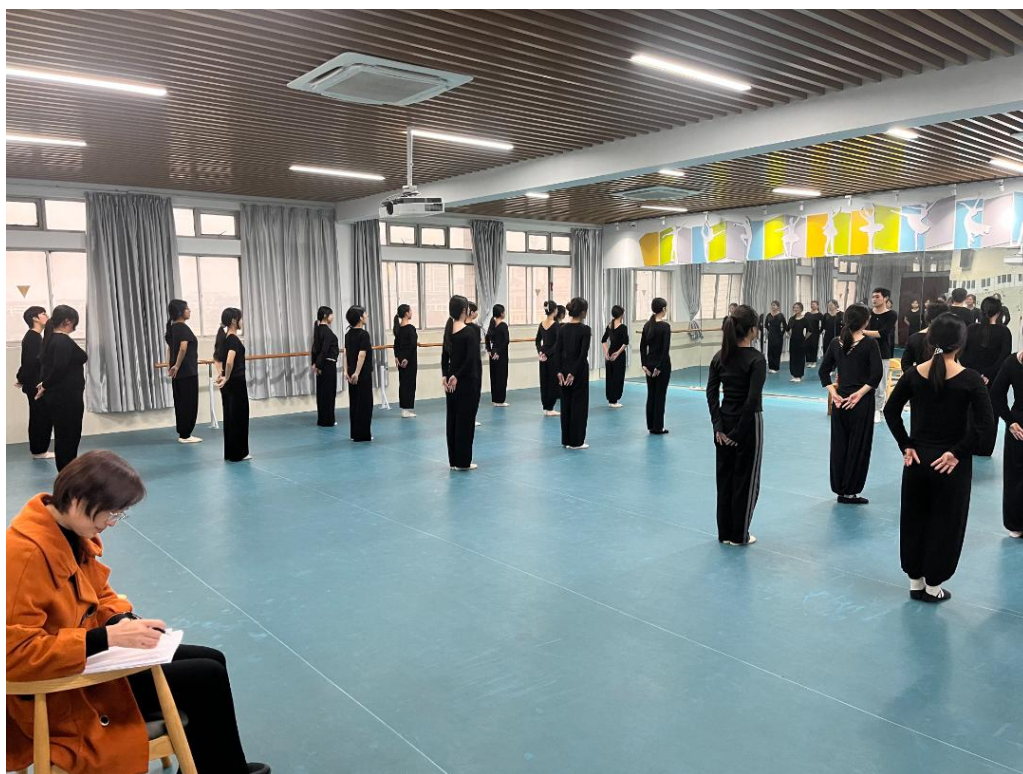
图 7-4-1 我校第四届“课堂教学质量月”听课活动现场

第四届“课堂教学质量月”活动的圆满落幕，标志着我校在教学质量提升道路上又迈出了坚实的一步。通过精彩的课堂展示与深刻的专家点评，我们不仅发现了教学中的闪光点，也明确了改进的方向。