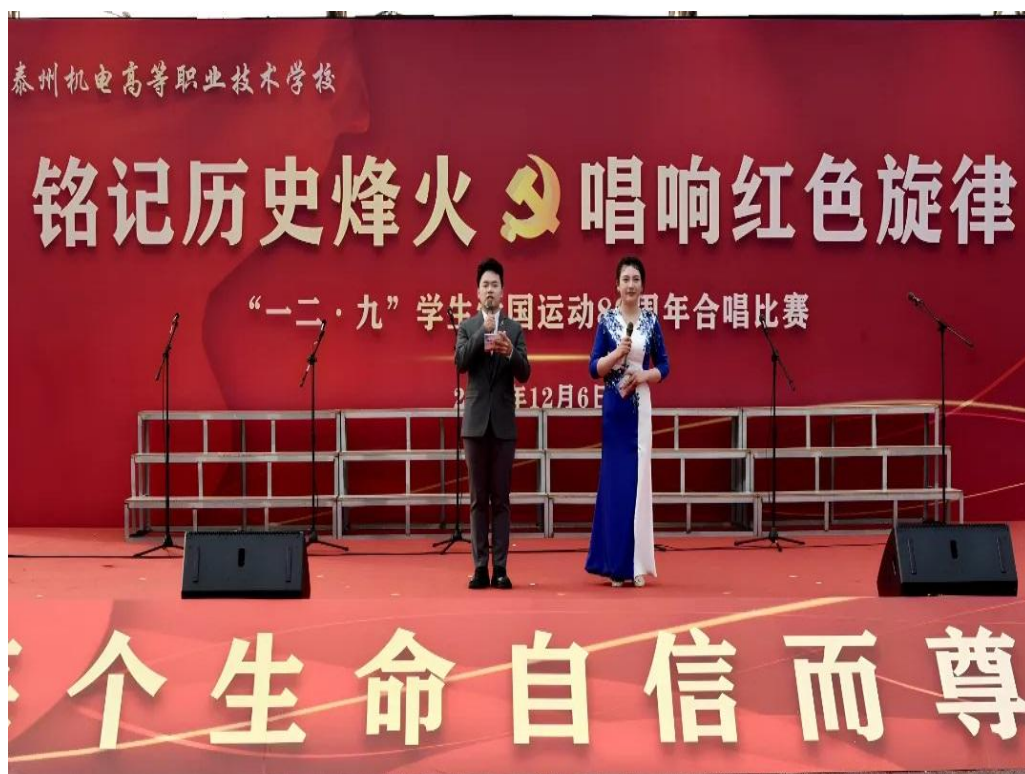
图 5-2-1 纪念“一二·九”运动 89 周年合唱展演活动现场

开展“弘扬先烈精神 传承红色基因”系列活动——清明祭扫。为使学生铭记历史，珍惜现在的和平生活，我校每年清明节都组织学生前往烈士陵园进行清明祭扫。通过缅怀先烈，了解革命先烈们为了中国的解放和革命的成功而努力战斗的艰辛历程，学习革命先烈不畏艰难、艰苦朴素的作风，发奋学习，将来为祖国做贡献。