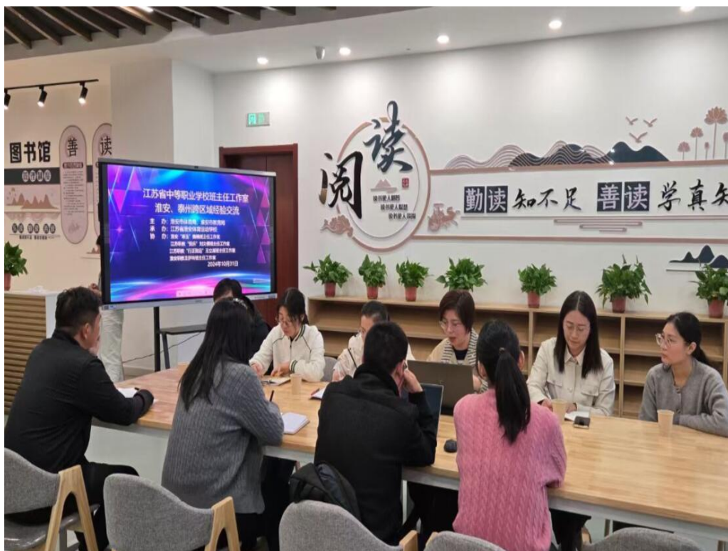
图 6-4-1 “悦乐”工作室活动纪现场

案例 6-4-2【省仇嫻财会名师工作室举办省级职业教育会计名师工作室交流活动】 为促进教师团队建设，推动职业学校会计专业的发展，泰州机电分院与江苏省吴中中等专业学校再次联合举办省级职业教育会计名师工作室交流活动。5月24日，在科研处解俊处长的带领下，仇嫻名师工作室一行7人赴苏州吴中中专校进行交流。