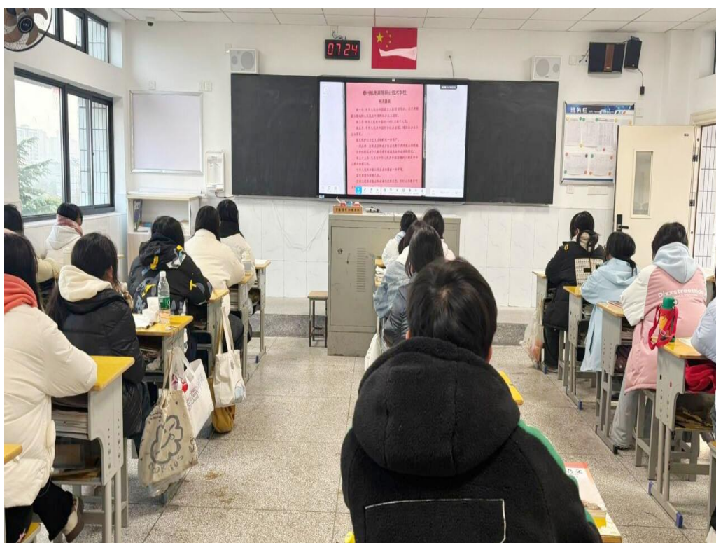
图 2-1-1 “宪法宣传周”活动现场

我校推行了涵盖学习练习、综合评价与法治实践三个阶段的“宪法卫士”行动计划。学生们积极参与，确保了 100%的参与率。通过丰富多彩的活动，我校成功提升了全校师生的宪法意识和法律素养，为构建和谐校园、法治社会奠定了坚实的基础。