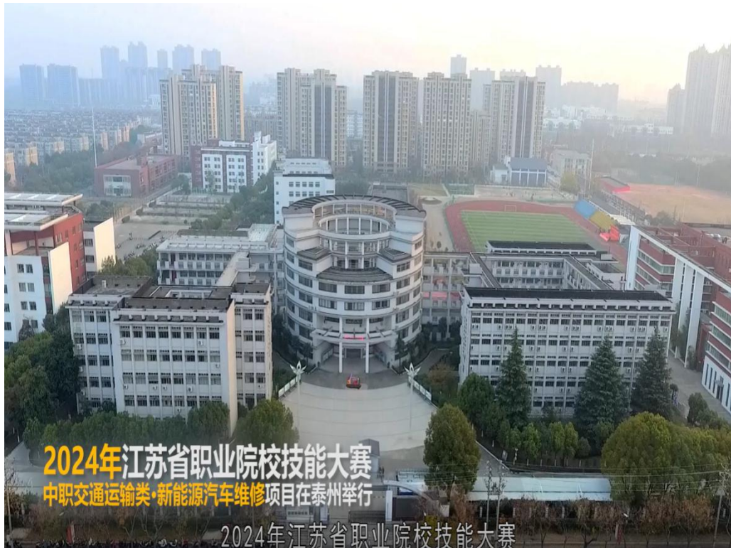
图 6-3-2 2024 年江苏省职业院校技能大赛新能源汽车维修赛项现场