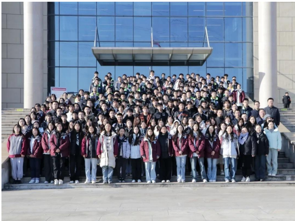
图 5-3-1 20 级大专班参观泰兴黄桥战役纪念馆现场

案例 5-3-1【我校 20 级大专班参观泰兴黄桥战役纪念馆】 11 月 26 日，我校 20 级大专班的同学们走进了泰兴新四军黄桥战役纪念馆，开展了一场意义非凡的国家安全教育实践活动。