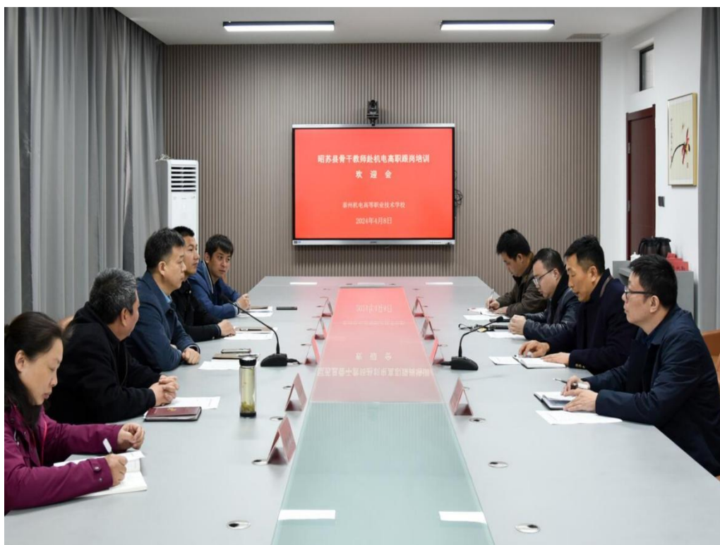
图 3-4-1 我校召开昭苏县骨干教师跟岗培训欢迎会现场

自2023年以来，我校已经接待西部地区6批次10余名教师的跟岗学习交流，与西部职教同仁一起共同分享职业教育智慧，为东西部职业教育的共同成长、共同进步贡献了机电高职力量。