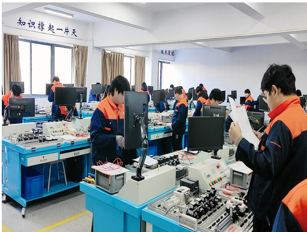
图 7-3-1 2024 年泰州市学业水平技能测试现场

此次中职学业水平测试的成功举办，离不开学校各部门的协同合作以及全体师生的共同努力。它不仅为考生们提供了一个展示自我的平台，也为学校进一步优化教学内容、改进教学方法提供了有力的参考依据。我校将继续秉持以生为本的理念，助力中职学子在成长成才的道路上迈出更加坚实的步伐。