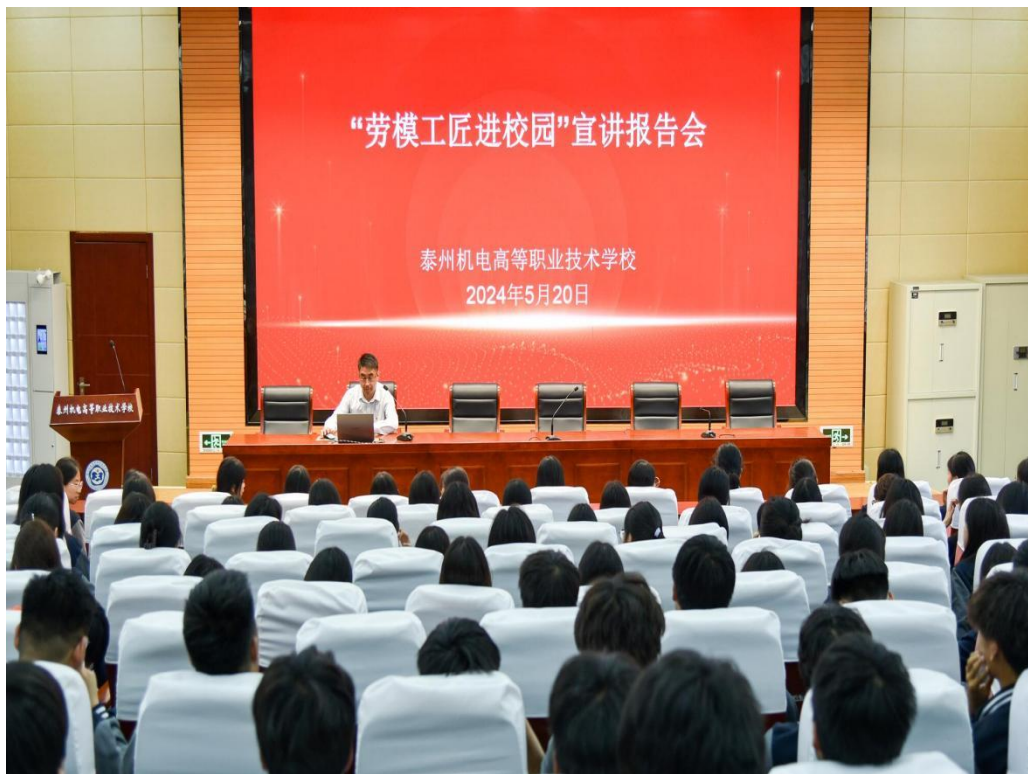
图 5-1-1 “劳模工匠进校园”宣讲报告会现场

此次劳模工匠进校园宣讲活动，不仅让学生们能够亲身感受到工匠精神的魅力，也有利于培养他们严谨、专注的学习态度，对于提升教育质量具有重要意义。