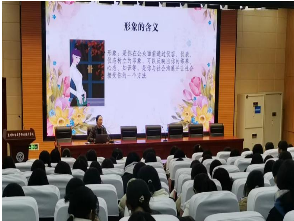
图 2-1-2 “礼仪浸润心田，品格塑造人生”礼仪培训活动现场

月 20 日特别邀请了泰州职业技术学院经济与管理学院礼仪培训讲师团，为经贸管理系 2024 级近 300 名女生开展了主题为“礼仪浸润心田，品格塑造人生”的专项培训活动。通过培训，学生不仅学到了具体的礼仪知识，更深刻理解了礼仪背后的文化内涵及其对于个人成长的重要性。