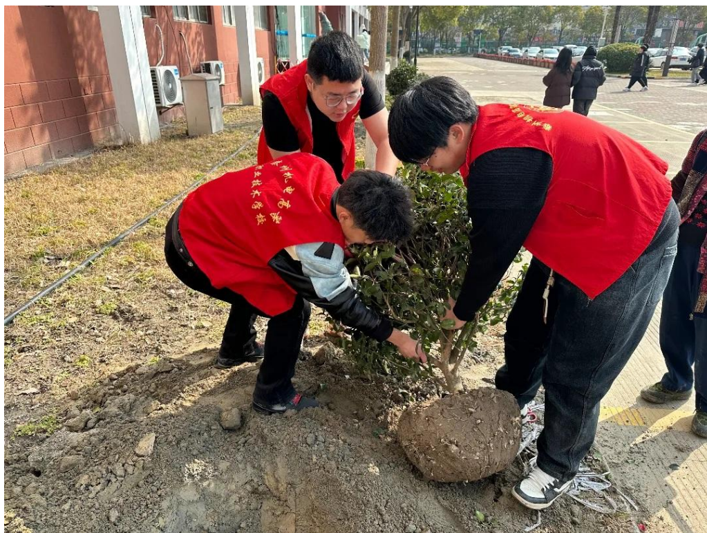
图 2-4-1 植树节生态文明教育系列活动现场

案例 2-4-1【我校开展植树节生态文明教育系列活动】 在第 46 个植树节到来之际，学校利用国旗下讲话向全体同学发出倡议：植绿护绿，美化家园。为宣传生态文明知识，普及绿色环保理念，各班开展植树节主题班会活动。